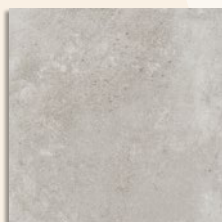
Ribadeo Gris G.132