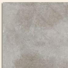
Ribadeo Grafito G.132