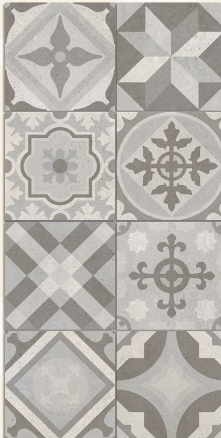
(1) Gredos G.140