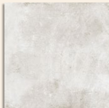
Ribadeo Blanco G.132